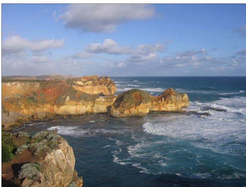
Great Ocean Road, Victoria, Austrálie

Pane ať jsi stéblo trávy nebo obyčejný list prosím dej ať aspoň trochu umím ve tvých vzkazech čist prosím dej ať řeči stromů aspoň trochu rozumím ať vědí že se učím a že nic neumím