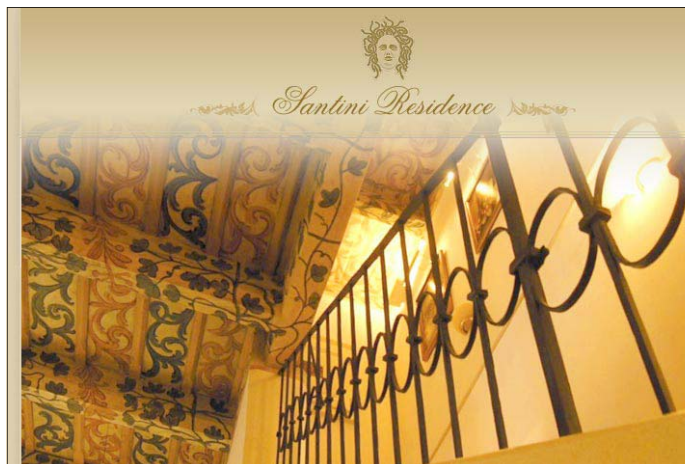
Malované trémové stropy v Santini Residence na Malé Straně