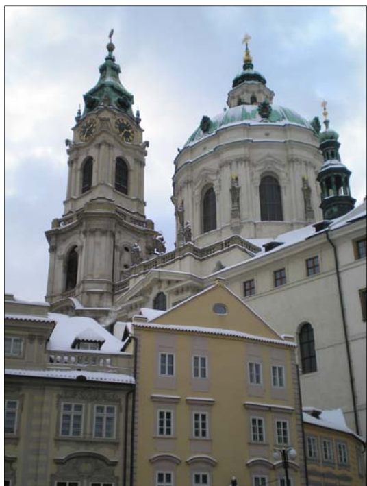
Svatý Mikuláš, Praha

zhudebněno - Hana a Petr Ulrychovi JAVORY